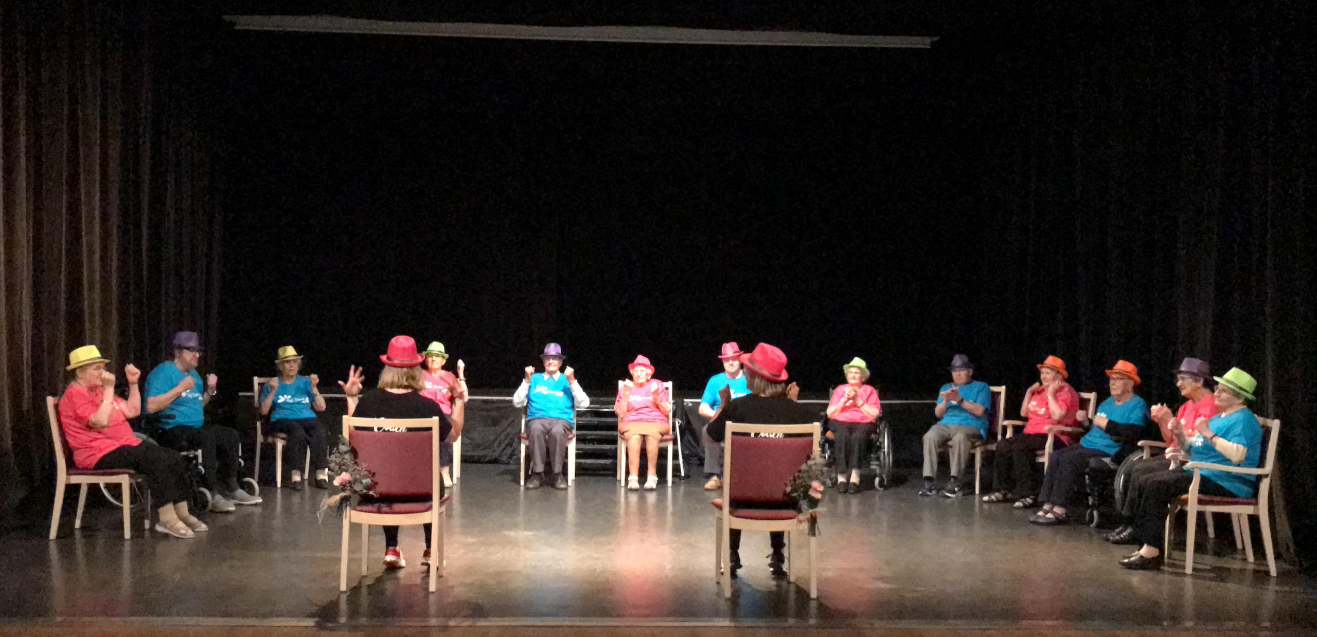
Résidence du Guic – Gala de danse