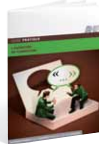
L'entretien de formation