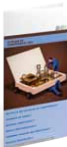
Bilan de Compétences (BC)