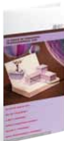
Congé de Formation Professionnelle (CFP)