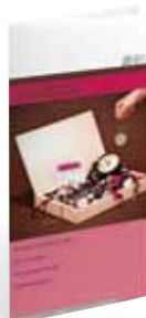
Droit Individuel à la Formation (DIF)