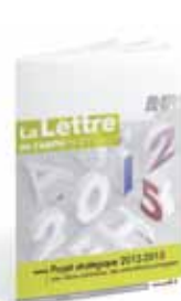
La lettre de l'ANFH

Le point sur l'ensemble des dispositifs et voies d'accès à la formation professionnelle tout au long de la vie pour les agents de la FPH.