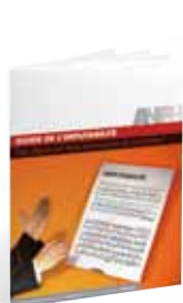
Guide de l'imputabilité des dépenses de formation

Trimestriel d'information sur la formation professionnelle dans la FPH. Le magazine de l'ANFH est adressé par courrier à l'ensemble des établissements et consultable sur anfh.fr