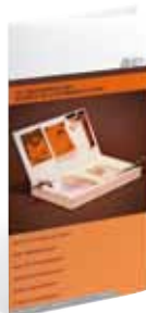
Validation des Acquis de l'Expérience (VAE)

Rubrique «Établissement» ► «Outils» ► «Commander des supports d'information»