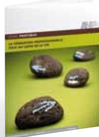
La formation professionnelle tout au long de la vie

L'ANFH publie et met en ligne plusieurs guides et revues réservés aux professionnels de la formation. Pour accéder à ces supports, connectez-vous sur www.anfh.fr