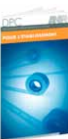
Des dépliants DPC pour l'établissement et

Synthèse des pratiques d'élaboration d'un plan d'actions sur l'apprentissage, ce guide vous aide à gérer un contrat d'apprentissage.