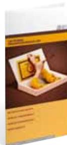
Études Promotionnelles (EP)