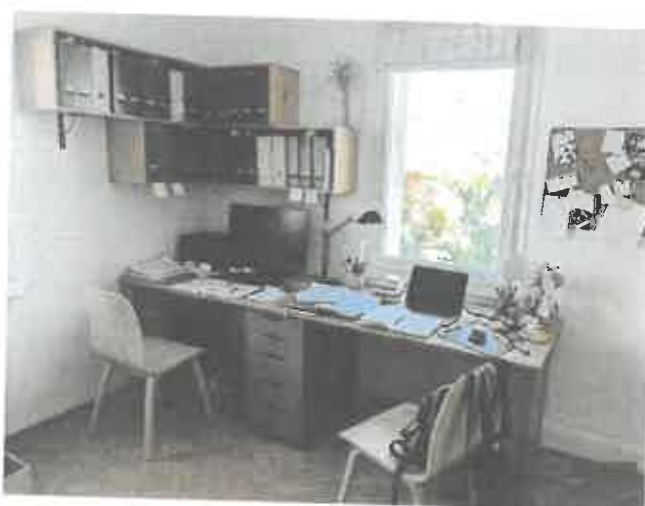
Bureau double et rangements