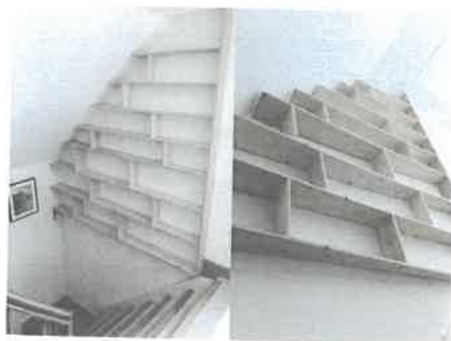
Bibliothèque sous combles